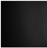
GFM73 schwarz gaufriert